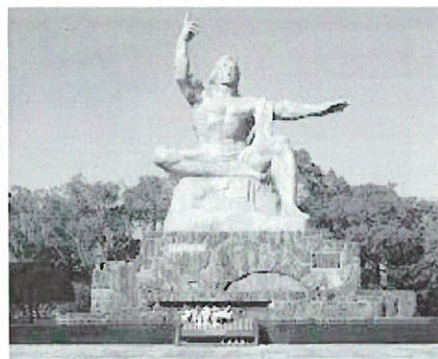
長崎の平和祈念像

問 なるべく早く「非核・平和都市宣言」をしてほしいが。 答 町長 東秩父村長とも足並みを揃えながら、なるべく早いうちに進めたいと考えています。 問 当町の「非核・平和都市宣言」の議案は町長提案を考えているのか。 答 町長 町が提案して議会の合意を頂きたいと考えています。 問 町長が誇れる実績とは。 答 町長 憩いのサロン「パティオ」、認知症カフェ「オレンジカフェ伊草」の開設、学力向上のための川島方式子ども学習システム、子育て支援拠点「かわみんハウス」開設や「かわみんタクシー」の導入、「埼玉中部資源循環組合」への加入、「かわじま未来塾」の立ち上げなどです。 問 今後やり遂げたい政策は。 答 町長 インター南側の開発事業と、農地集積事業だと思っています。