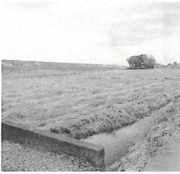
川島産レンコンの栽培予定地

答 さくら通り「役場入り口」交差点から南に、下脇橋付近までです。約50本の苗木を8m間隔で植え一部を2列にします。元の道路の部分を遊歩道に使用し、公園的なイメージ