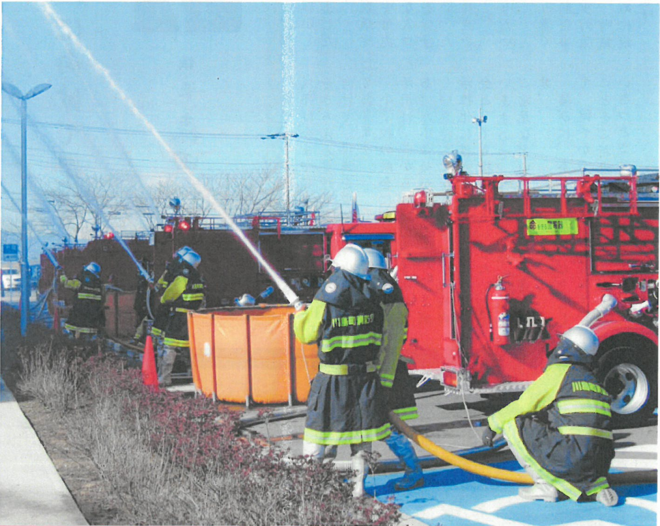
「川島町消防出初式」