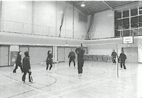
廃校後も利用可能となる体育館

答 月額3万2千円で月払いです。契約者の申し出で、扶養申告のため4月から6月は2万円、残りの月は無料との事で契約変更しました。来年度は、従来通りの契約を予定しています。